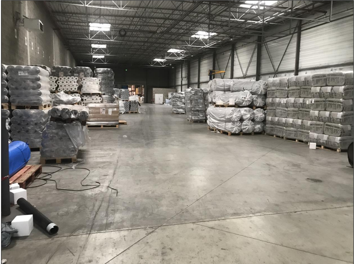
Prise de vue : Vue intérieure du hall 1 dans lequel sera implanté le projet