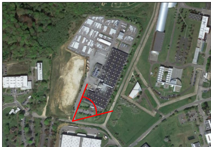
Localisation de la prise de vue ( Google Earth )