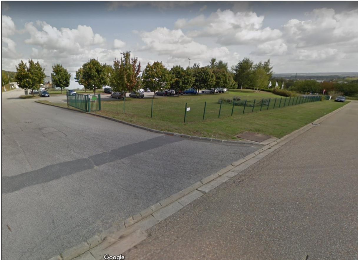
Prise de vue : Entrée du site SOPREMA